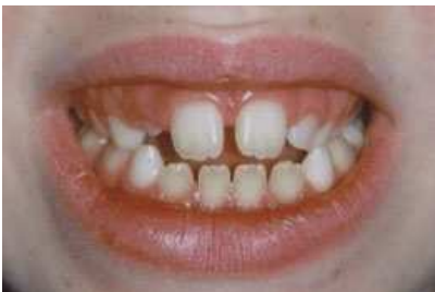
durante la terapia logopedica