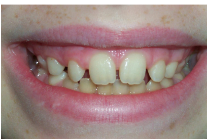
dopo la terapia logopedica e ortodontica

E' importante consultare subito un foniatra, un ortodontista e un logopedista per sapere se vostro figlio può essere aiutato attraverso una valutazione globale.