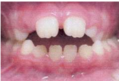
prima della terapia logopedica

Le foto sottostanti mostrano i risultati prima e dopo la terapia per i vizi orali!